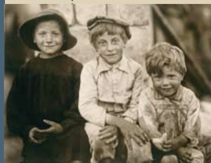
Enfants de SAint-PAUL aux bois, 1919 et enfants d'aujourd'hui.